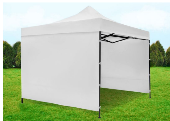
Namiot expressowy - 3m x 3m